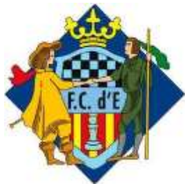
Federació Catalana d'Escacs